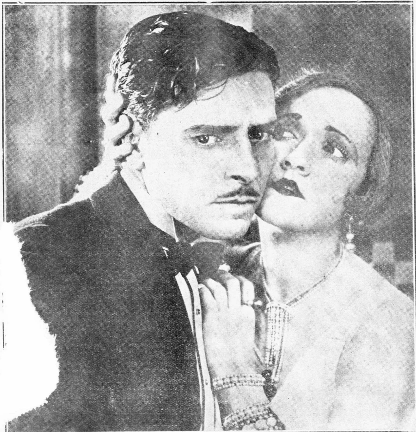
ΡΟΝΑΛΔ ΚΟΛΜΑΝ ΚΑΙ ΚΩΝΣΤΕΝΣ ΤΑΛΜΑΤΖ

Οι δύο ήπτεροχοι καλλιτέχνη που πρωταγωνιστοῦν εἰς τὸ ἔργον «Ἡ ἀδελφὴ τῆς ἀπὸ τὸ Παρίσι». Τὸ ἔργον προβάλλεται ἀπὸ αὔριον Δευτέραν εἰς τὸν Κινηματογράφον «Ἀττικόν»