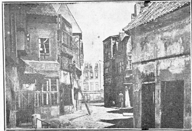
Πόλις μετὰ τὸ στούντιο. Ἐνα μέρος μᾶς πόλεως κατασκευασθείσης εἰς τὰ ἐν Νουμπάμπειοπεργκ στούντιο τῆς γερμανικῆς ἐταιρείας U.F.A.

» Τώρα ἔμωσ ποῦ τὸ ἐτελεώσω καὶ θεωρῶ τὸν «Βασιλέα τῶν βασιλέων» ὡς τὸ σπουδαιότερον ἔργον ἀπὸ ὅσα ἐπραγματοποίησα ἔως τῶρα, ὅα ἔχω τὴν εὐχαρίστησιν εἶναι ἅπα τὴν ἀνάγκην κατὰ τὸν ὅσον εἶναι ἡμεῖς «ἐκεῖνοι, ὁ ὁποῖος εἶχε τὴν ὄρατιστέραν, τὴν πλεόν ἐπαινετὴν καὶ τὴν περισσότερον δραματικὴν ἱστορίαν τῆς ζωῆς ἐν τῷ Μεγάλῳ Ἐβημνευμένῳ».