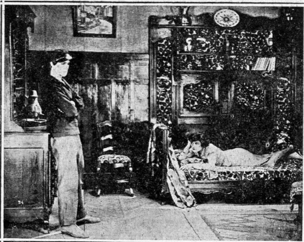
Μιά σκηνή από τό γνωστόν έργον του Ρισπέν «Σόδεργαν»