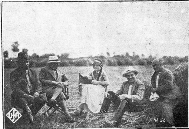
Ἡ σκηνοθέτης Χάινς Σβάρτς, ἡ Νεῖτα Πάρλο καὶ ὁ Βίλλυ Φρίτς κατὰ τὸ γυρίσμα τῆς ταινίας «Οὐγγρικὴ Ραψωδία».

κάτω ἀπὸ τὸ παράθυρό της σιγὰ τὴν ἀγαπημένη του. Συναντῶνται στὸ κῆπο καὶ φιλοδονταί. Ὁ Του- ρότσκι γίνεται περὶ ὀρμητικῶς, αὐτὴ τὸν ἰκετεύει νὰ παραμείνῃ λογικῶς· ἀλλ' αὐτὸς ἀδυνατεῖ νὰ τῆς ὑ- ποσχεθῆ ὅτι θὰ τὴν παντρευθῆ, γιὰ εἶνε ψυχρὴ καὶ σώματι ἀφοσιωμένος στὸ στρατιωτικὸ καὶ οὐδέποτε θὰ ἐδέξεται ἓνας κόμης Τουρότσκι νὰ γίνῃ ἡγήρτης. Βαθεῖα προσβεβλημένη τὸν ἀποχωρίζεται ἡ Μαρίκα. Αὐτὸς πηγαίνει στὸ πανδοχεῖο ὅπου παίζουν οἱ ἀ- τοίγαννοι ὁμα- έστως ὑπερή- φαναφορεῖ στὴ μουτουνη ὀρα του τὰ ἄνθη, ποῦ τοῦ ἐπέτα- ξε ἡ κοκέττα στρατιωτὴ γίν α. Ποὺς ξέρεῖ ἂν ἡ κούρα τοῦ κόσμου τὸν ἀ- γαπήσῃ; Γιατὶ ὄχι; Δὲν εἶνε ἡ πρώτη φο- ρά... Ἡ πα- λῆς, γλυκὲς παθητικῆς με- λωδίας ἀντη- ροῦν. Τὸ δυνα- τὸ οὐγγαρέζικο κραοὶ ἀστρά- φτει χρυσοκί- τρινον στὰ πα- τήρια καὶ ὁ Τουρότσκι-φο- νάζει στὸ μαστῶ «Τσάρδας» καὶ ρίπτεται στὸν ἄ- γοιο οὐθοῦ τοῦ χοροῦ γιὰ νὰ ξεκάσῃ.