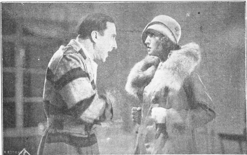
Μία χαρακτηριστικὴ σκηνὴ τοῦ ἔργου τῆς U.F.A. «Μανολέσκου» παραγωγῆς Μολόχ-Ραμπονίφες, κατὰ σκηνοθεσίαν τοῦ Τουρζάνσκου. Εἰς τὴν ἀνωτέρο εἰκόνα οἱ πρωταγωνισταὶ τοῦ φιλμ Ἰβάν Μοσζούιν καὶ Μποργγιτέ Χέλιμ. Πλὴν τῶν ἀνωτέρο καλλιτεχνῶν λαμβάνουν μέρος καὶ ἑτεροὶ δύο διάσημοι ἀστέρες, ὁ «Αἴνου» Γκέοργκ καὶ ἡ Ντίτα Πάφλο. Ἡ ταινία αὕτη ἡ ὁποία θεωρεῖται ἕνα ἀπὸ τὰ σοῦπερ-φιλμ τῆς U.F.A. θά προβληθῇ κατὰ τὴν προσεχῆ περίοδον εἰς τὸ «Οὐρα Πάλας». Τὴν ἐκμετάλλευσιν ἔχει ἡ ἐταιρεία «Συμβατικὴ».

νισμοῦ καὶ ἄλλοι κινηματογράφοι, ἀλλὰ μέχρι τῆς στιγμῆς καμμία σχετικῶς ἐνδείξεις δὲν ὑπάρχει. Ἡ κινηματογραφικὴ κίνησις τῆς πόλεως μᾶς γενικῶς εἶνε κατὰ τι μικροτέρα τῆς τῶν προηγουμένων μηνῶν καὶ ὡς πρὸς τὰ ἔργα κανένα ἀπολύτως ἀξίας δὲν εἶδαμεν. Dem. Marozzatos