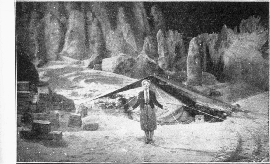
Μία θαυμασία σκηνή από το μεγαλειώδες έργον τής Ούφρα «ΤΑΞΕΙΜ ΣΤΗ ΣΕΛΗΝΗ». Το έργον όποιου σκηνοθέτης εινε ο διάσημος Φριτς Λαγκ έγένετο επί τη βάσει του όμοιονμου μυθιστορηματος του Ίουλιου Βέρν. Το «γύριμα» του έργου διηρκεσε επί δύομισι ολόκληρα (2 1/2) έτη και έδαπανήθησαν τεράστια ποσά. Προηγαστούν οι Βίλλυ Φριτς και Γεσέτα Μάουερ. Το έργον θα προβληθί προσεχώς εις τον έν τη πόλει μας Κινηματογράφον «Ούφρα Πάλας».

Το ταξείδιον θα διετελεσθί υπό την προστασίαν έπιστημονικών Έταιρειών και θα έχη σκοπόν να εξετύπησῃ είν ένάσχην τρόπον να δημονογηθί μία ταξεία συγγονομία μεταξύ Ευρώπης και Αμερικης.