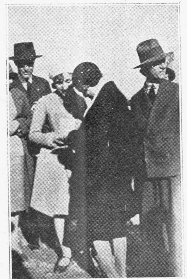
Ἡ Μαίρη Πικφορδ ἐπὶ τῆς Ἀκροπόλεως διανε- μουσα αὐτόγραφα εἰς τοὺς θαυμασιῶν τῆς

Ἀφ' οὗ ἔληξεν τὸ συμβόλαιόν μου μετὰ τὸν ἐν λόγῳ θιάσον, ἐφοίτησα εἰς τὸ Πανεπιστήμιον τοῦ Χάρβαρντ διὰ νὰ συμπληρώσω τὰς γνώσεις μου εἰς τὴν Λατινικὴν. Πολὺ γρήγορα ὅμως ἐνόησα ὅτι τὸ τοιοῦτον δὲ ἀπῆται πολλὰ ἔτη σπουδῶν καὶ ἀπε- φράσινα νὰ κερδίσω καλλίτερον τὸ γορῶ μου ἐργαζῶ-