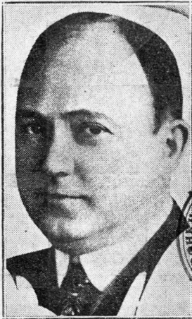
ΧΑΡΛΕΪ ΚΛΑΡΚ, ό νέος πρόεδρος της Εταιρείας Φόξ Φιλμ Κορπορέσιον

Τόσκαν (Κέρκυρα) . Ν' άπειθυνθητε εις τόν κ. Γαζιδάην διά να σάς πληροφορήσθ εις ειδικότερος ήμων.