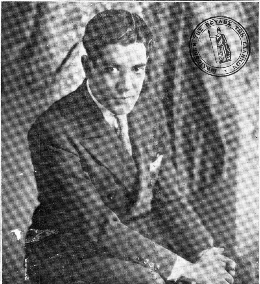
NTON ZOZE MOXIKA

Ο ώρατος καλλιτέχνης και διάσημος τενόρος, «αστήρ» της Φόξ Φίλμ, ο οποίος πρωταγωνιστεί εις την νέαν, Ισπανικής υποθέσεως, ταινίαν «Πόσο κοστίζει ένα τρελλό φίλι», ένα από τα θαυμασιώτερα έργα της προσεχούς περιόδου