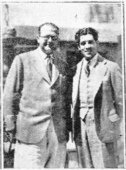
Ο κ. Φ. Χάρλεϊ καὶ ὁ ὄμοιος τενορός Ντόν Ζοξέ Μορζι, πρωταγωνιστῆς τοῦ ἔργου «Ἐνα τρελλὸ φιλί» κατά φωτογραφίαν ληφθεῖσαν εἰς Χόλλυγουντ.

—Τότε τὸ πάγμ αλλάσσει. Εἶνε ἐλεύθερος να διαθεῶν τὴς ὥρας τῶν ὅπως τοῦς ἀρέσει. —Καὶ τί κάνουν; —Διασκεδάζον. —Ἐπάρχουν τὰ μέσα; —Ἀσφαλῶς ὄχι μόνον τὸσα ὅσα θὰ ὑπολογίζετε. —Ἐπάρχουν πῶτῳ, νεύναγκ, χαμπάρι. —Πῶς; εἶνε πρὸ τῶν Καρὸ Μονάχο, τὸ Μπράουν Ντέριμν δηλαδὴ. Τὸ σκαθὸν καπέλλο ὀνομαζόμενον ἔτα διότι ἡ ἐξωτερικὴ του ὄψε, παρουσιάζει τὴν εἰκόνα ἐνὸς μεγάλου σκούρου καπέλου. Δευθεντῆς τοῦ Μπράουν Ντέριμν ἂν σὰς ἐνδιαφέρει να τὸ μάθετε, εἶνε ὁ τέως σὺζυγος τῆς Γλῶρια Σβάνσον. Ἐπάρχει ἀκόμα τὸ περιφρημον χαμπάρι George Olsen τοῦ ὁποῖου ἡ ὄχηστρον διὰ να ἐννοήσετε τὶ ἀξίζει λαμβάνει μέρος εἰς τὸ ἔργον