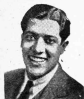
Δόν Ζοζέ Μοξίκα