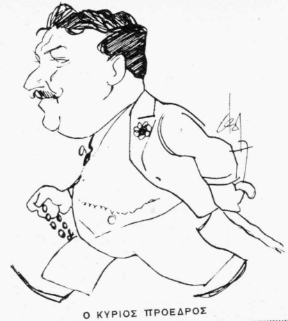
Ο ΚΥΡΙΟΣ ΠΡΟΕΔΡΟΣ ΕΝΩΣΙΣ ΤΗΣ ΠΑΤΕ ΜΕ ΤΗΝ ΓΚΩΜΟΝ

ΕΝΟΙΚΙΑΖΕΤΑΙ μηχανή προβολής SIMPLIX εν άριστή καταστάσει. Πληροφορία παρά τω κ. Β. Π. Γκέρστερ, τέρμα όδοϋ Άχαρνών Άθήνα.