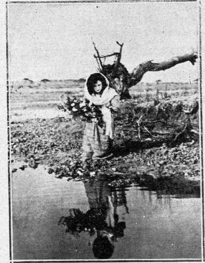
Η Μάσα πλανιέται τρελλή, νομίζοντας την θάλασσα για τάφο του παιδιού της, είχνη λουλούδια

Η μόνη του άσכולία τώρα ειναι, αφού την ξεφορτώθηκε, ή κατάκτησις της θεατρίνας. Έκείνη όμως έξ-