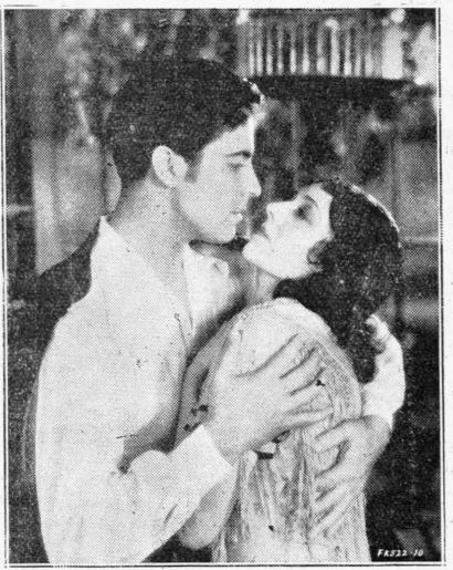
Ο συμπαθέστατος Ραμόν Νοβάρρο και ή Σούζν Βερονί εις τó Ισπανικήν υπόθεσεως νέον έργον «Ο τραγουδιστής τής Σεβίλλης». Ταινία όμιλουσα γαλλιστι με σκηνοθεσίαν τού ίδιου Νοβάρρο. Παραγωγή και έκμετάλλευσιν Μετρό-Γκόλντουντ-ν Μάιερ. Θα προβληθη έφέτος εις τινά τών κεντρικωτέρων κινηματογράφων

Πληροφορούμεθα έξ έγκύριου πηγής ότι ό περίφημος άστήρ τής Μετρό—Γκόλντουντ—Μάρε Τζωαν Κράουφορντ την όποιαν πρόκειται να θαμράσωμε κατά την προσεχή κινηματογραφικήν περιόδον εις διάφορα άριστούργημα: Χορεύετε τρελλές, χορεύετε», «Ντροπαλές παρθένας» «Πληρομένη» κ. ά.θα έπιχειρήση προσεχώς ταξείδιον χάρις άναμνηχίς ανά την Ευρώπην.