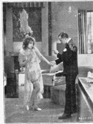
Μία σκηνή από την γαλλισι όμιλούσαν ταινία «Ο εύ καλύτερος όρόμος» (Quand on est belle) με την όραϊαν Λιλί Νταμιτά και τών Άντριε Λουκέ, που θα προβληθή κατά την προσεχγή περίοδον έν Άθήναις. Παραγωγή και έκμετάλλεσις Μετρό Γκόλντον'ν Φιλμς

Μία βίλια, την όποιαν κάλλιστα θα ήδύνατο κανείς να όνομάση «Βίλια και φλέρτ» είναι εκείνη εις την όποιαν ή Φρανσουά Ροζύ ά συνεκέντρωσε μερικους έκλεκτους φίλους της. Πρόκειται για μερικά άταίριατα ξεγυάρια τα όποια μέσα εις την πολυτέλειαν των θανάμιας κήπων της άμαρτωλής βίλλας, ξεαναγίνονται πάλιν ταριασά. Η γυναικες έξ άλλου είναι γοητευτικές και οι άνδρες πρόθυμοι. Ένοισται ότι όλα αυτά συμβαίνουν μέσα εις ένα έξαιρετικά μοντέρνο και διασκεδατικό φίλμ, με τίτλον «Άς είμηθα χαροόμενοι», το όποιον προβάλλεται με έξαιρετική έντιμυνη εις τόν μεγάλο παρισιόν κινηματογράφο «Μαντελέν». Προταγωνιστούν με έξαιρετικό κέφι ή Λιλί Νταμιτά, ή Μόνα Γκόγια, ή Τάνια Φεντόρ και άλλοι συμπαιθείς Γάλλοι καλλιτέχαι.