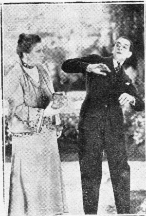
ΠΩ, ΠΩ, Η ΠΕΘΕΡΑ ΜΟΥ