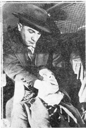
Ο ΤΡΕΛΛΟΣ ΑΕΡΟΠΟΡΟΣ

ΚΑΘΕ ΕΡΓΟΝ ΚΑΙ ΕΝΑ ΑΤΟΥ ΓΙΑ ΤΟΝ ΚΙΝΗΜΑΤΟΓΡΑΦΟΝ ΣΑΣ