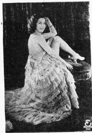
ΜΑΡΘΑ ΕΓΚΕΡΘ, πρωταγωνίστρια τοῦ ἔργου «Στὴν τρέλλα τοῦ χοροῦ», ἥτις δικαίως ἔχει ἀποκληθεῖ ἡ γυναικὴ μετὰ τοῦ μεγαλειότερου σὲς ἀπὸ ἡμᾶς.

Κύριοι διευθύνοντες τὴν κινηματογραφικὴν οἰκογενειαν, εἶνε ζῶτικόν συμφέρον καὶ νὰ καθοδηγήσῃτε μετὰ εὐλικρίνειας τὴν ἐπαρχίαν, τῆς ὁποίας τὸ μέλλον εἶνε πολὺ σκοτεινόν καὶ περισσότερον ἀδηλον.