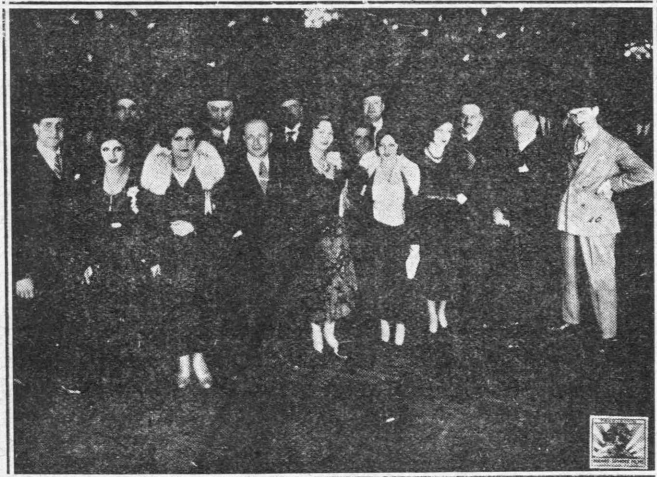
Οί ιδρυταί, οί διευθυνταί, τεχνικόν προσωπικόν και οί έρμηνευταί τών κυριωτέρων ρόλων της πρώτης όμιλοσής αγγυπτιακής ταινίας «Τό τραγοῦδι της καρδιάς» της αγγυπτιακής κινημ. εταιρίας Nahas Spnings Films

—Η νέα ταινία τού Τσάρλυ Τσάπλιν «Τά φάτα της πόλεως» προσεβλήθη εις τόνκινηματογρ.