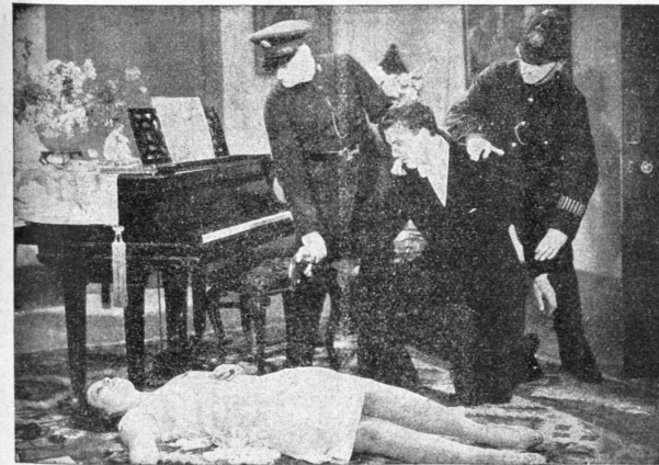
Μιά σκηνή ἀπ' τὸ ἔργον «Τὸ τραγοῦδι τοῦ Σογό».Θὰ προβληθῆ εἰς τὸ Ἰντεαί

Κατὰ τὰς τελευταίας τηλεγραφι- κῆς πληροφορίας ὁ Τσάρλι Τσάπλιν ἔδωσε μεγαλοερεπὴ δεξίωσιν, εἰς τὴν πρόσβατον προσκληθέντες διάφοροι πολιτικοί, οἰκονομολογικοὶ καὶ καλλι- τεχνικοὶ προσωπικότητες. Τὰ ἔσοδα τῆς ἀνωτέρω δεξιώσεως ἀνήλθον εἰς τὸ πῶσόν τῶν 5 χιλ. λιρώνηλαθῆ 1587 000 δραχμάς.