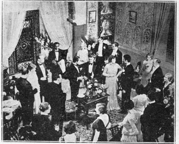
Μία ώρα σκηνή της τουρκιστί όμιλούσης ταινίας “Ο επαίτης της Σταμπούλ”

κόδια των πυραμιδών, στην κομψή βίλλα της ή Σεμιρά γανούμ ζήταει μέσα στην άνια τόν άδειον σφόν της γάβη καί, ένα μοτίβο που θάποτελούσε τόν άώνα ένός καινούργιου οριάντισου της. Γιατί δέν πρέπει να ξεχνάμε πως ή Σεμιρά είναι μυθιστοριογράφος και μάλιστα έξακουσμένη. Μαζύ με τους φίλους της προσπαδόν να βροδύν ένα όνειρο. Για μία στιγμή ή νέα Τουρκία με τα ιστορικά της οικοδομήματα, το μουσικόπαδο παρελθόν της, τις άνα-