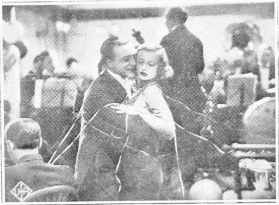
Ἐνα ὄρατο ντυμέτο ἀπὸ τὸ ἔργον. «Θὰ με παντρευτῆς» μετὰ τὴν Καμίλλη Χόρν καὶ τὸν Βίλλυ Φρίτς. Ἀποκλειστικὴ Ἐκμετάλλευσες τῆς ἐταιρίας «Ἑλληνικὴ Κινηματογραφικὴ Ένωσις»