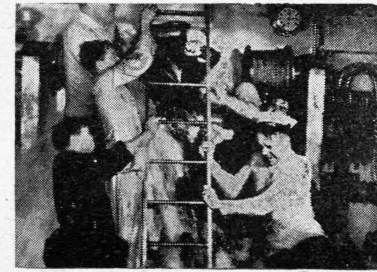
ΤΡΑΓΩΔΙΑ ΕΙΣ ΤΟΝ ΒΥΘΟΝ

Μία σκηνή του έργου. Ένώ τά έλάσματα ένός διαμερίσματος του βυθισμένου ύποβρυχίου ύποχωρουν ύπό την τρομακτικην πίεσιν της θαλάσσης και τά ύδατα κατακλύζουν τό διαμέρισμα, οι έν αυτώ άνδρες καταβάλλουν άπέληπιδας προσπάθειαις διά να διέλθουν εις άλλο διαμέρισμα. Παραγωγή Μπαρτίς Γ'τερνάσιαναλ «Εμπεταλλεωος Χάι-Φίλμ». Γ. Συναδινός και Γ. Παπαστέφας.