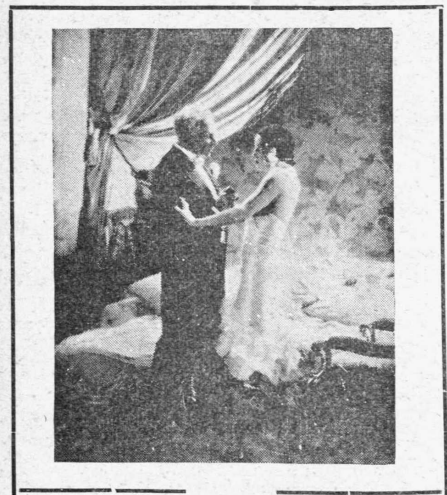
ΜΠΡΙΓΚΙΤΕ ΧΕΛΜ-Α. ΜΠΑΣΣΕΡΜΑΝ

Τὶ ἐντύπωση θὰ τοῦ ἐπροκάλεσε; Ἄγνωστον!.. Ὁ ἐξορίστος τὸ Ντόνν δὲν δίδει δυστυχῶς συνεντεύξεις.