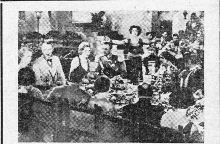
Η ΠΑΡΘΕΝΟΣ ΤΩΝ ΟΡΕΩΝ 'Η μεγαλειότατη μουσική ταινία που έγινε μέχρι σήμερα, Ισπανικής ύποθέσεως, με συμμετοχή της περιφημου Τουγγανικής όρχήστρας Alfredo's Band. Παραγωγή Μπρίτις 'Ιντεντάσιοναλ. Έκμετάλλευσις 'Χάι-Φίλμ, Γ. Συνοδοΰς και Γ. Παπαδόφας.

Τό νέον φιλμ της «Μετρό» εις τό όποιον πρωταγωνιστούν οι τρεις άδελφοί Τζών, Λιονέλ και 'Εθελ Μπάρρμμορ, έτελείωσε. Διά την πλήρη έπιτυχία του ή «Μετρό» δέν έφείσθη έξόδων και λέγεται ότι δαπανήθησαν διά την κατασκευήν του περι τάς 140.000.000 δραχμιών!