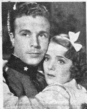
Ὁ Ντικ Πάουλ καὶ ἡ περιφημοῦ Ροῦμπυ Κήλερ στὸ μουσικὸ ἀριστούργημα «Μία νύχτα στὴ Χαβάϊ»