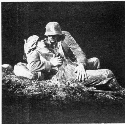
Μία συναρπαστική σκηνή από τό πολεμικόν έργον «Stosstrupp 1917» του όποιου ή υπόθεσις έβραβεύθη υπό της γερμανικής Άκαδημίας.

Η Σιμόνη Σιμόν, άν κρίνη κανείς από τας φωτογραφίας του φιλμ πού έκυκλοφόρησαν, είναι θαυμαστή σε δροσερή εμφάνισι και σε νειάτα. Άλλωστε ό ρόλος αυτός είναι ιδιαίτερος κατάλληλος δι' αυτήν και ένθυμίζει πολύ τής γενικής γραμμής της ημιοργίαν της εις την «Πρώτην Φλόγαν».