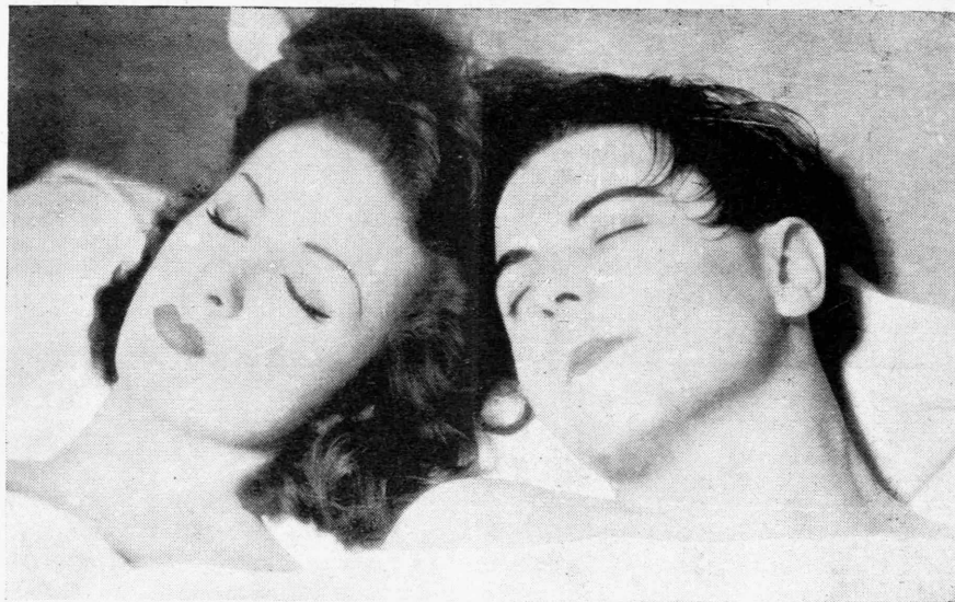
Σκηνή ἀπὸ τὸ ρεαλιστικὸ ἀριστούργημα "Ἡ ΛΕΣΧΗ ΤΩΝ ΚΤΡΙΩΝ ,, εἰς τὸ ὅποιον πρωταγωνιστεῖ ἡ ἀποκάλυψις τοῦ 1936 ΝΤΑΝΙΕΛ ΝΤΑΡΠΠΙ