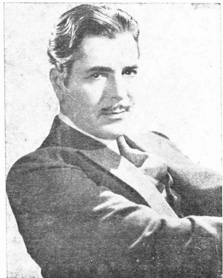
Ὁ πρωταγωνιστὴς Γουὐρνερ Μπάξτερ

Ἵποκλισημα Θεσπνίκης Ὁδὸς Τσιμισκή 7 Τηλεφ. 28.95