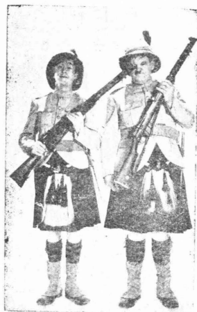
στὴν κωμική τους ἀποθέωσι