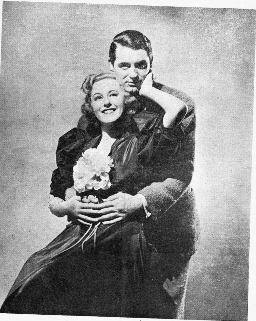
Η Γκράις Μορ και ο Κάρι Γκράντ στο «ΟΤΑΝ Η ΚΑΡΔΙΑ ΚΤΥΠΑ» (προσωρινός τίτλος) Μουσικόν όριστούρημα του σκηνοθέτου Ρόμπερτ Ρίσκιν, εφάμιλλον με τὰ καλλίτερα τῆς Μάρθα Έγγερθ και τῆς Ζαννὲτ Μακντόναλδ.

(Έκμετάλλευσις : Α. Ε. Κ. Ε. «ΑΝΖΕΡΒΟΣ»)