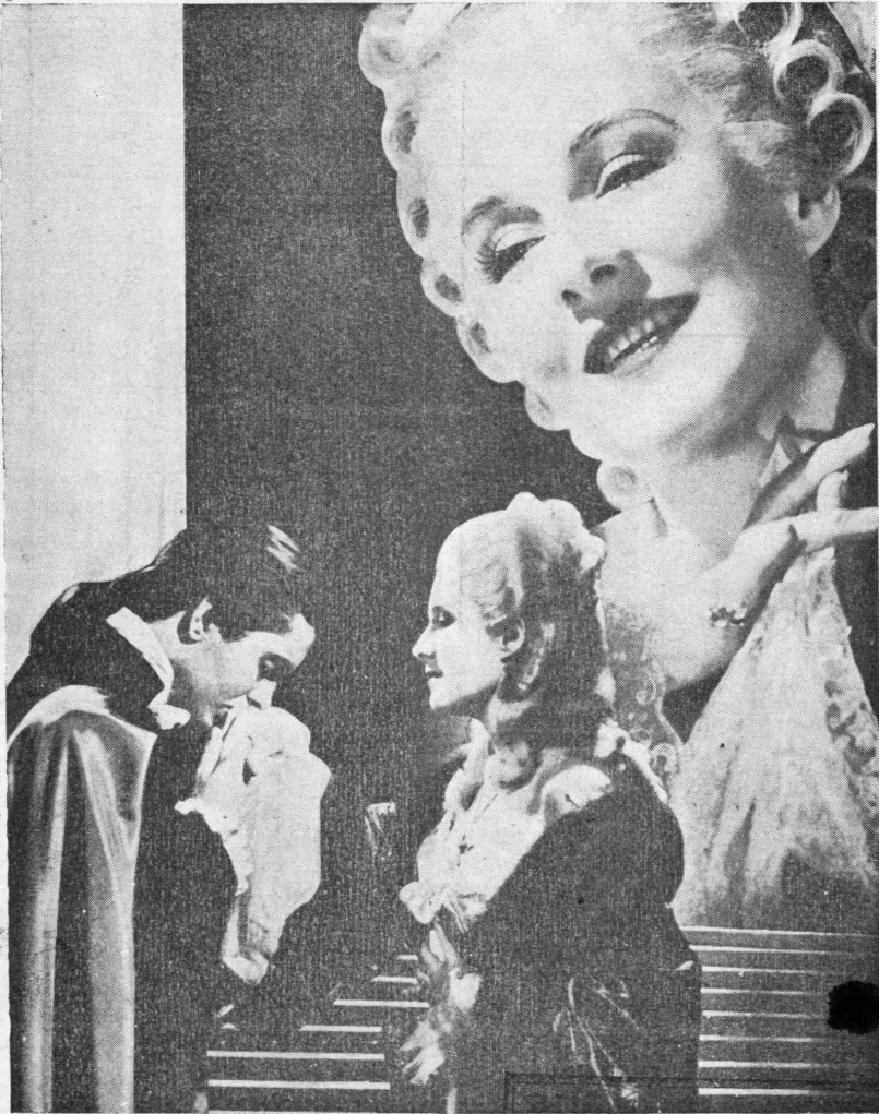
Η Νόρμα Σήρερ και ο Τάυρον Πάουερ στο κορυφαίο φιλμ του Ίωβιλαίου της «Μέτρο» "ΜΑΡΙΑ ΑΝΤΟΥΑΝΕΤΤΑ."