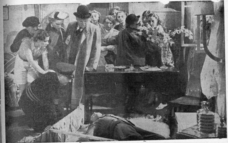
Μία χαρακτηριστική σκηνή από τὸ μεγαλειώδους σκηνοθεσίας ἔργον τοῦ Τουρζάνσκυ «Τὸ κρυπτογράφημα L. B. 17» με τὸν Βίλλυ Μπίργκελ, τοῦ ὁποῦ τὴν ἐκμετάλλευσιν ἔχει ἡ Άνων. Ἑταιρία Κινηματογραφικῶν Ἐπιχειρήσεων «Άνζερβός».