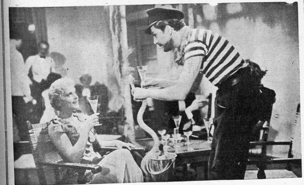
Ἡ μεγάλη γερμανικὴ καλλιτέχνις Λουίζα Οὐβρλιχ καὶ ὁ συμπαθέστατος Βίκτωρ ντὲ Κόβα εἰς μίαν σκηνὴν τοῦ ἔργου «Άδάμ καὶ Εὐα» διὰ τὴν ὑπόθεσιν καὶ τὴν σκηνοθεσίαν τοῦ ὁποῦ εὐφήμως ἐκφράζεται ὁ εὐρωπαϊκὸς τύπος. Άνων. Ἐκμετάλλευσις Ἑταιρίας «Άνζερβός».