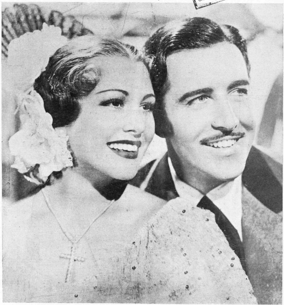
Ο γοητευτικός Τζών Μπόλς και το νέο αηδόνι της οθόνης Γκλέντις Σβάρτου, της Μετροπόλιταν Όπερα της Νέας Υόρκης στην εξαιρετική μουσική ταινία ΡΟΖΙΤΑ που θα προβληθή την Δευτέραν εις το «Πάνθεον».