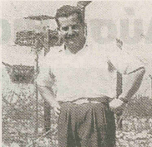
Στα κρατητήρια της Κοκκινότριμιθιάς