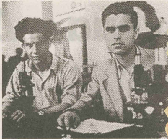
Στο εργαστήριο χημείας της Γεωπονικής Σχολής