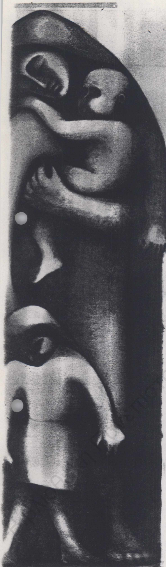
◀ Α. Διαμαντῆ, «Μάννα».