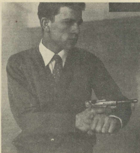
ΝΙΚΟΣ ΣΑΜΨΩΝ: ὁ πιστολέρο «πρόεδρος τῶν 8 ἡμερῶν».

Ο ΣΤΡΑΤΗΓΟΣ Ἀρμπούζης ἄλλωστε, γιὰ νὰ διαψεύσει τίς ὑποθέσεις μας, μπορεῖ νὰ μᾶς πληροφορήσει ποιοὶ εἶναι οἱ ἀξιωματικοὶ πὸν τιμωρήθηκαν αὐστηρά.