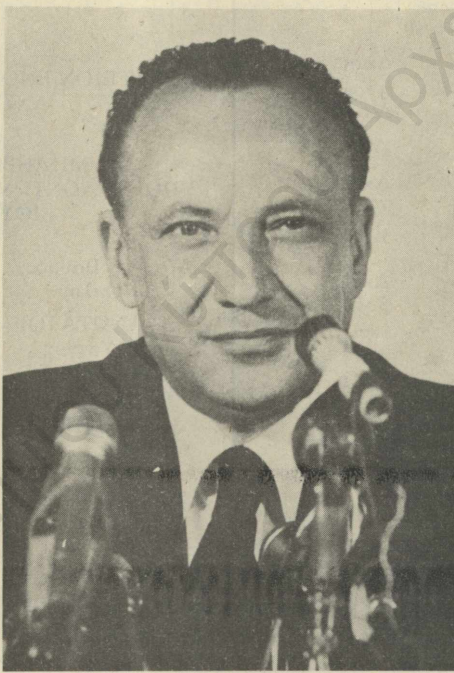
ΓΛΑΥΚΟΣ ΚΛΗΡΙΔΗΣ: ἀντικατέστησε προσωρινὰ τὸν Σαμψών.

ΑΛΛΑ, ἀπὸ τὴ μελέτῃ τῆς κατάστασης τῶν ἀξιωματικῶν πὸν ἐπισυνάπτεται στὸ ἔγγραφο τοῦ στρατηγοῦ Ἀρμπούζης καὶ στοὺς ὁποίους ἀπευθύνεται, βγαίνει ὅτι πολλοὶ ἀπὸ αὐτοὺς πὸν εἶχαν ἀνάμειξη στὸ πραξικόπημα παραμένουν στὸ στρατεύμα. Ἡ διαπίστωση αὐτὴ ὁδηγεῖ στὸ συμπέρασμα ὅτι αὐτοὺς (ποιοὺς ἄλλους;) προστατεῖ ἡ διαταγή.