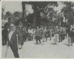
Εορτασμός 25ης Μαρτίου σελ. 3