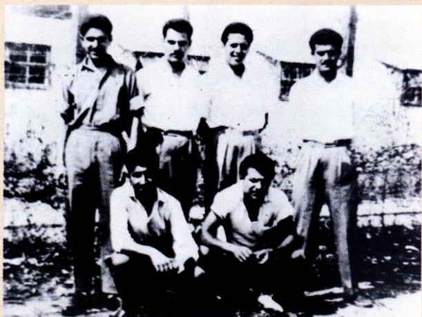
Μαθητές αγωνιστές της ΕΟΚΑ στο Στρατόπεδο Συγκέντρωσης Κοκκινότριμιθιάς.

νεκρές ζώνες όπου κινούνταν μόνο οι φρουροί και ανιχνευτικά λυκόσκυλα. Ο Κρατούμενος μπορούσε να διαβάσει, να αθλείται με πρωτόγονα μέσα, να ασχολείται με τη λεπτουργική και να αντλεί ψυχική δύναμη με τη συμμετοχή του στη μελέτη της Αγίας Γραφής.