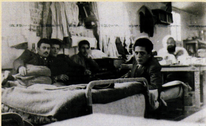
Όψη από εσωτερικό παραπήγματος όπου διέμεναν 30 Πολιτικοί Κρατούμενοι.