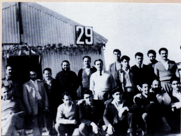
Πολιτικοί Κρατούμενοι στο διαμέρισμα Α του Στρατοπέδου Συγκέντρωσης Κοκκινότριμιθιάς.

σε 5 λεπτά οι οργανωμένοι Πολιτικοί Κρατούμενοι πυρπόλησαν τα Κρατητήρια Κοκκινότριμιθιάς. Την εξέγερση ακολούθησαν μαζικοί βασανισμοί από μονάδες του Αγγλικού στρατού που επέδραμαν στα παραπήγματα και χτυπούσαν ανελέητα τους Κρατουμένους που τους άφηναν άγρυπνους με πυροβολισμούς και λιθοβολισμούς. Τέτοιες εκδηλώσεις είχαν σαν αποτέλεσμα την άρση των προνομίων, δηλαδή την απαγόρευση αποστολής ή λήψης των πάντα λογοκριμένων επιστολών και των εβδομαδιαίων επισκέψεων. Στις περιόδους τιμωρίας η προσπάθεια καταρράκωσης της αξιοπρέπειας του ανθρώπου ήταν χυδαιότερη, όπως η δημόσια γύμνωση των Κρατουμένων, και σκληρότερη από άλλες φορές, όπως η απομόνωση στο πειθαρχείο και η ποινή επιβίωσης με ψωμί και νερό.