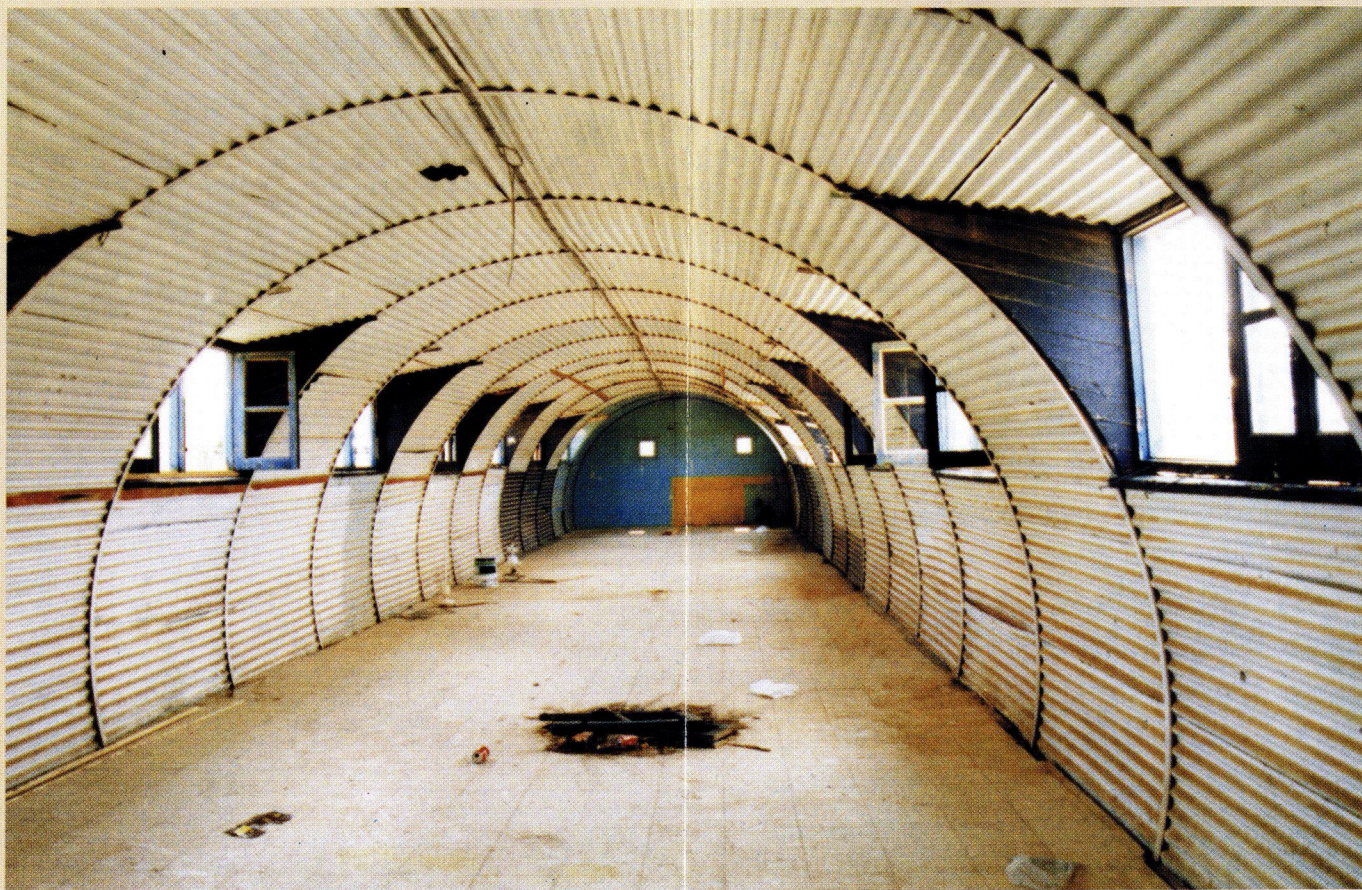
Παράπηγμα των Κρατητηρίων Κοκκινωτριμιθιάς όπως είναι σήμερα.