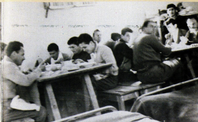
Πολιτικοί Κρατούμενοι κατά την ώρα του γεύματος στο εσωτερικό παραπήγματος.