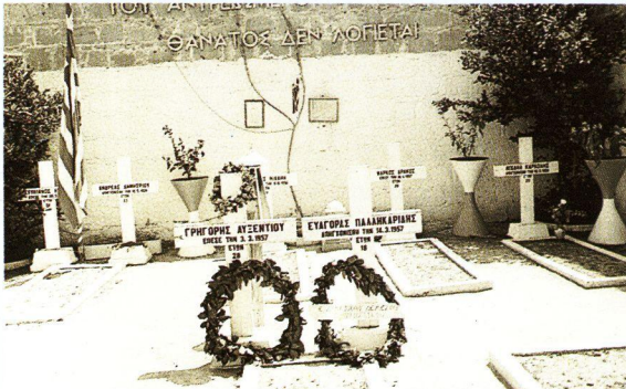
Φυλακισμένα Μνήματα. 13 παλληκάρια του αγώνα τάφηκαν εδώ κρυφά από τους Άγγλους, για να αποφευχθούν οι λαϊκές διαδηλώσεις

“Την Ελλάδα θέλομεν κι ας τρώγωμεν πέτρες”.