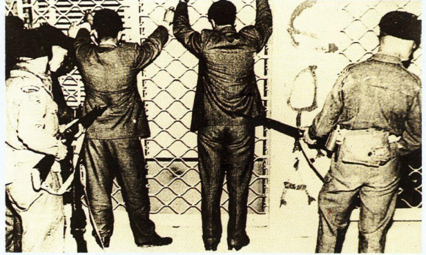
Καθημερινή σκηνή στους δρόμους της Κύπρου. Έρευνες, συλλήψεις, βασανιστήρια...