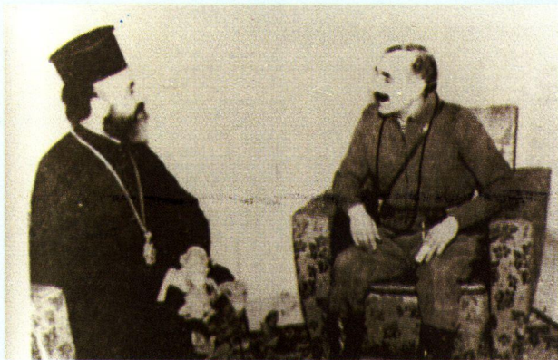
Κάτω από την ηγεσία του Εθνάρχη Μακαρίου και του Διγενή οι Έλληνες της Κύπρου έγραψαν ηρωικές σελίδες στην ιστορία του Ελληνισμού

Ο αγώνας της Ε.Ο.Κ.Α. υπήρξε κατ' εξοχήν αγώνας των νέων. Σ' αυτούς ο ελληνισμός υποκλίνεται.