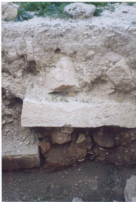
α: Ίχνη πυρκαγιάς στο κατώτερο στρώμα.