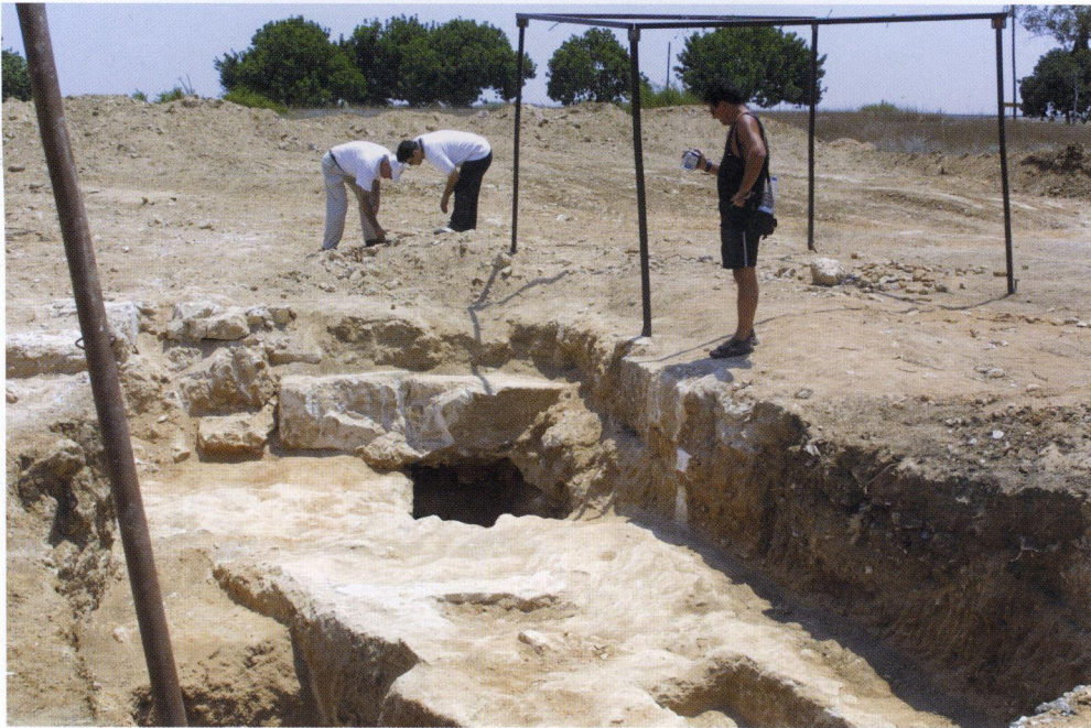
α: Πλήθος οστράκων δίπλα στους τάφους που εντοπίστηκαν. Καμία πρόνοια για τη στρωματογραφία του χώρου, όπως απαιτεί η αρχαιολογική επιστήμη.