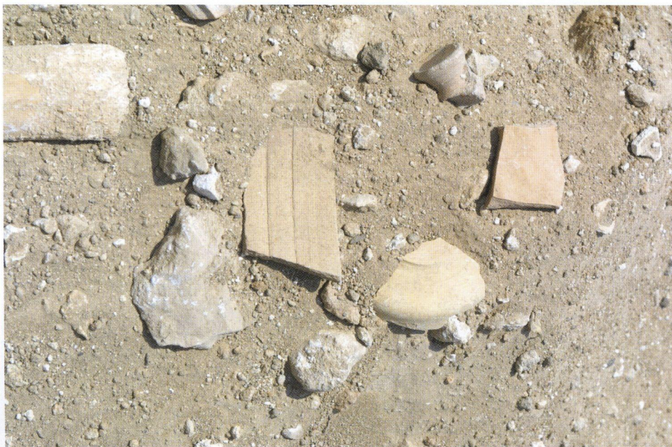
β: Κι άλλα όστρακα από τη βορεινή πλευρά.