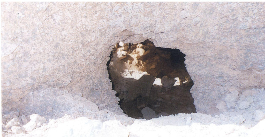
γ: Μέσα από το άνοιγμα που δημιούργησαν στον τάφο οι οικοδομικές εργασίες διακρίνεται μικρή σαρκοφάγος ή οστεοθήκη σε κομμάτια.