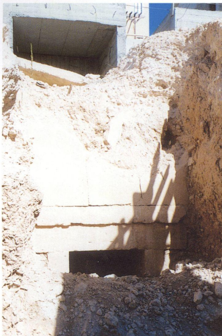
α: Η πρόσοψη του ενός από τους δυο τάφους της Αμαθούντας. Η είσοδός του διακρίνεται πίσω από το σωρό του χώματος.