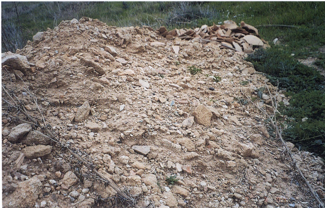
α: Σωρός χωμάτων έξω από λάκκο με πλήθος οστράκων που πετάχτηκαν χωρίς λόγο.