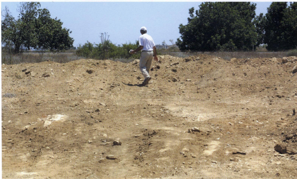
α: Στο έδαφος διακρίνονται σαφώς τα ίχνη των τροχών του εκσκαφέα και ο σωρός των χωμάτων που απέθεσε. Στα χώματα μέσα υπήρχαν εκατοντάδες οστράκων και αρκετά διακρίνονται στην επιφάνεια του εδάφους που δημιούργησε η χούφτα του εκσκαφέα.