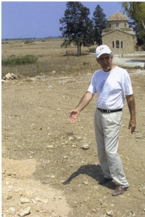
α: Όστρακα στα χώματα που ανέσκαψε ο εκσκαφέας στη βόρεια πλευρά.