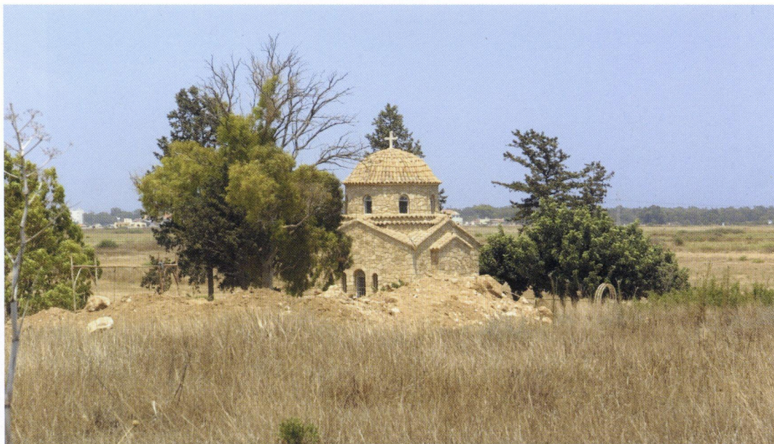
β: Τα χώματα όπως τα απέθεσε ο εκσκαφέας δίπλα στο παρεκκλήσι πάνω από τον τάφο του Απ. Βαρνάβα, στην ανατολική πλευρά του αρχαιολογικού χώρου.