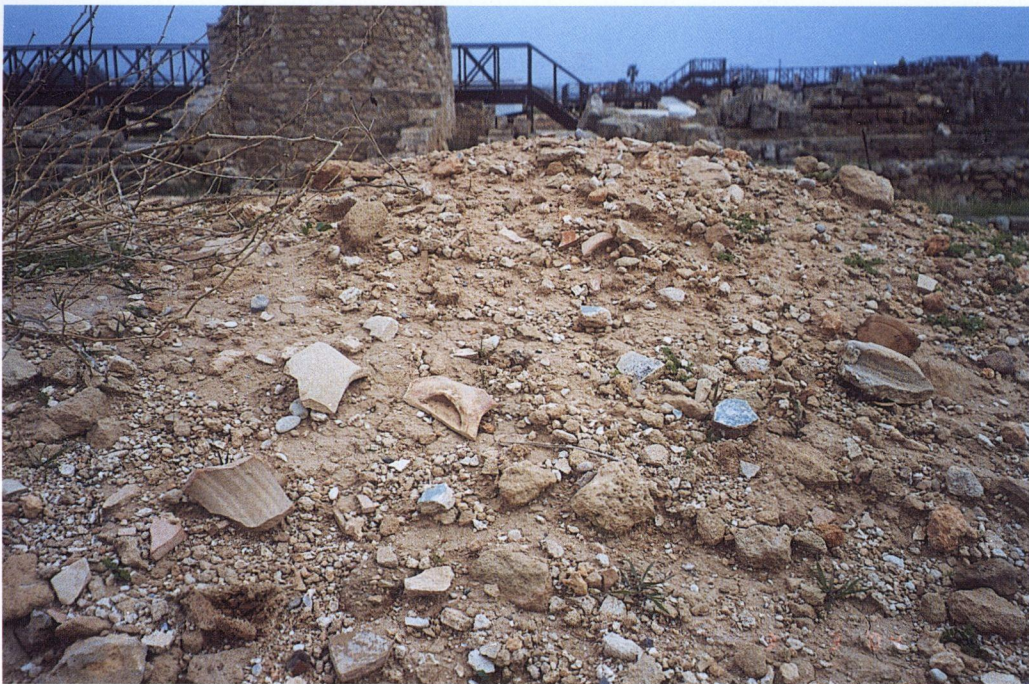
α: Στο σωρό του χώματος διακρίνεται και εδώ πληθώρα τεμαχίων αγγείων αλλά και τεμάχια ζωγραφισμένων τοίχων.