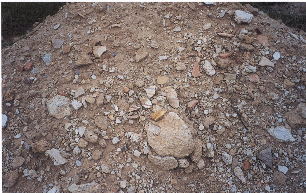
β: Σωρός χωμάτων έξω από άλλο λάκκο με πλήθος οστράκων και τεμαχίων ζωγραφισμένων τοίχων.