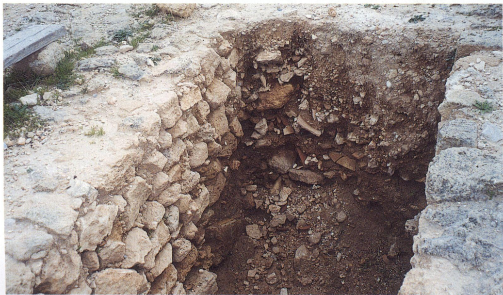
β: Τα ίχνη καύσης στο κάτω μέρος του λάκκου πρέπει να έχουν συνάφεια με αυτά του πιν. XXα. Τέτοια ίχνη παρατηρήθηκαν και σε τρίτο γειτονικό λάκκο.