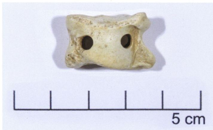
β: Αστράγαλος διάτρητος σε δύο σημεία, μάλλον για ανάρτηση στο λαιμό ή το χέρι από τον κάτοχό του, ίσως κάποιο παιδί που ζούσε κατά την ελληνιστική ή ρωμαϊκή περίοδο στην Πάφο. Βρέθηκε στους σωρούς των χωμάτων έξω από λάκκο που ανοίχτηκε από το Τμήμα Αρχαιοτήτων.