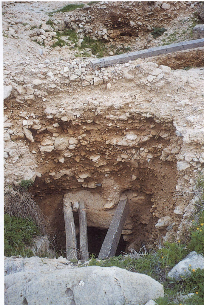
β: Η οπή στο κάτω μέρος της φωτογραφίας δείχνει τον κύριο οχετό των ομβρίων υδάτων που δημιούργησαν οι αρχαίοι μας πρόγονοι. Η ύπαρξή του είναι γνωστή και είναι απορίας άξιο το πώς κάποιος έσκαψε και εδώ για να στερεώσει στέγαστρο κοντά στην έπαυλη με το ψηφιδωτό του Ορφέα.