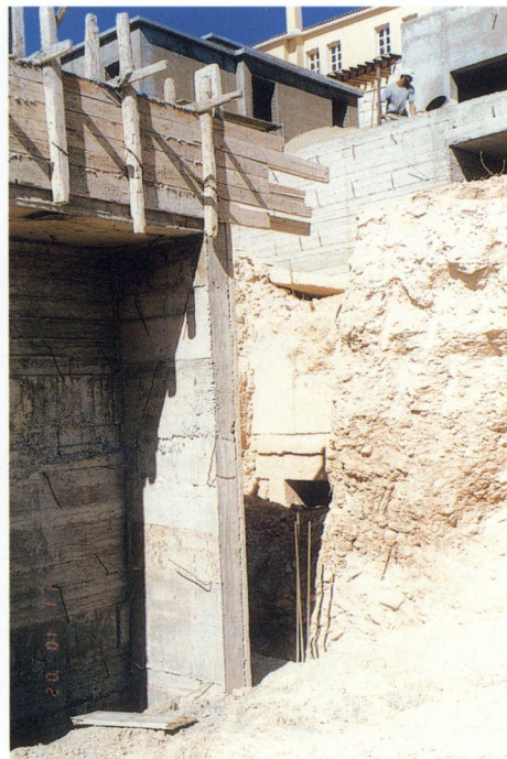
β: Η πρόσοψη του δεύτερου τάφου πριν αυτός φυλακιστεί στα τσιμέντα.