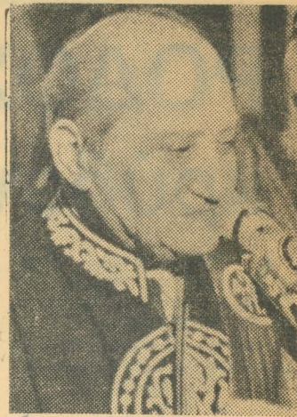
«Το πληρωμένο αυτό κάθαμα, που εξευτελίζει το 'Ελληνογενών όνομα»

Μ Ε ΤΗΝ ΚΟΜΨΗ αυτή φράση (ετό πληρωμένο αυτό κάθαμα...) και άλλες, αντίστοιχες, ανθρωποφαγικές εκδηλώσεις, ο Έλληνας Τύπος υποδέχτηκε, στα 1953, την πρώτη, γαλλική, έκδοση της μικρής Νεοελληνικής 'Ιστορίας του Νίκου Σβορώνου. Δημιούρ-