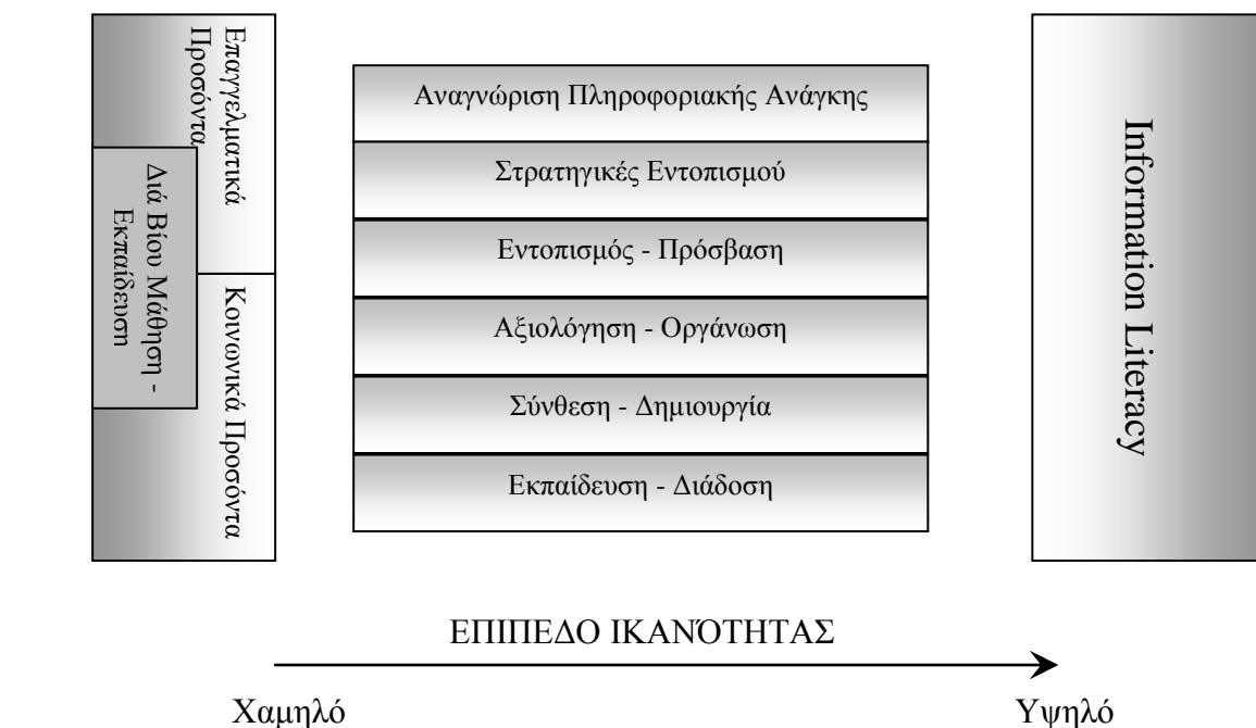
Σχήμα 1. Information Literacy και Βιβλιοθηκονομικά Προσόντα

διδασκαλία πέρα από τα καθιερωμένα μαθήματα στις αίθουσες των ιδρυμάτων και αυξάνει την εκπαιδευτική, μαθησιακή και, τελικά, επαγγελματική ικανότητα των σπουδαστών, με την αξιολόγηση, διαχείριση και χρήση της πληροφορίας, μέσα από ένα ανανεωμένο και προσαρμοσμένο στις σύγχρονες απαιτήσεις, εκπαιδευτικό πρόγραμμα, πάντα σε συνεργασία με τις διάφορες υπηρεσίες πληροφόρησης.