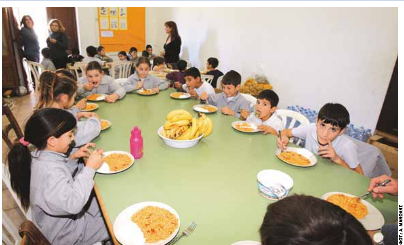
Στην Καρπασία η ζωή συνεχίζεται... Άλλοτε θα έμοιαζε με μυστικό δείπνο. Τώρα οι εγκλωβισμένοι μαθητές τρώνε γεύμα κάθε μεσημέρι. Το λεγόμενο σουσάιτο. Το ότι δεν είναι δείπνο δεν ακριζείται μόνο με την ώρα. Είναι που λείπει και ο Ιούδας από το τραπέζι. Εμείς όλοι που βολευθήκαμε. Μια οικογένεια μαθητές και δάσκαλοι. Κοινό γεύμα, κοινός αγώνας επιβίωσης. >>3

Το τι σκοπεύει να κάνει ο πρόεδρος του ΔΗΚΟ αναμένεται να διαφανεί σήμερα όταν θα επιστρέψει στο γραφείο του και θα συζητήσει τις εσωκομματικές εξελίξεις με τους στενούς του συνεργάτες, η γνώμη των οποίων φαίνεται να έχει ιδιαίτερη βαρύτητα για τον κ. Καρογιάν. Τις δικές της κινήσεις μελετά η ομάδα της ηγεσίας που διαφωνεί με τον κ. Καρογιάν και βρίσκεται σε αναμονή αποφάσεων. Σύμφωνα με πληροφορίες μας αυτό που έχουν διαμηνύσει προς κάθε κατεύθυνση είναι πως δεν θα αποδεχθούν τη θυματοποίηση οποιουδήποτε στελέχους του κόμματος. Ο Νίκος Κλεάνθους, με συνέντευξη του στον «Φ», απευθύνει προς όλους έκκληση να «βάλουν μυαλό» και νερό στο κρασί τους.