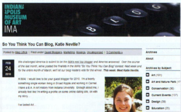
Εικόνα 3 Το πλάγιο τα Indianapolis Museum of Art άρθρα περιοδικών, επιστημονικών συνεδρίων και διαδικτυακές πηγές

Πρόκειται για μια επίσης πολύ σημαντική ενότητα στην οποία συγκεντρώνεται αρθρογραφία και βιβλιογραφία σχετικά με τις βιβλιοθήκες τέχνης και