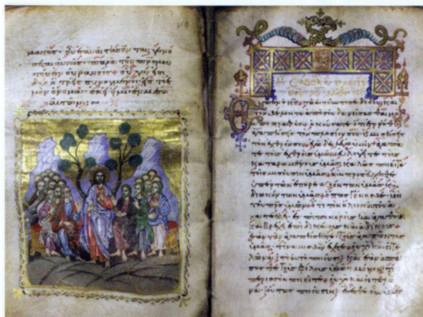
Εικόνα 1: Παλίμψηστο χειρόγραφο, Μπενάκη αρ. 48

Ο καταιγισμός από δωρεές βιβλίων έχει προκαλέσει το αδιαχώρητο στην Κεντρική Βιβλιοθήκη. Ωστόσο, μέσα στο 2010, όπως ανακοινώθηκε επίσημα στις εφημερίδες από τον Διευθυντή του Μουσείου Μπενάκη κ. Άγγελο Δεληβορριά, θα πραγματοποιηθεί νέα επέκταση του χώρου της, προκειμένου να δοθεί ανάσα και να αντιμετωπιστεί