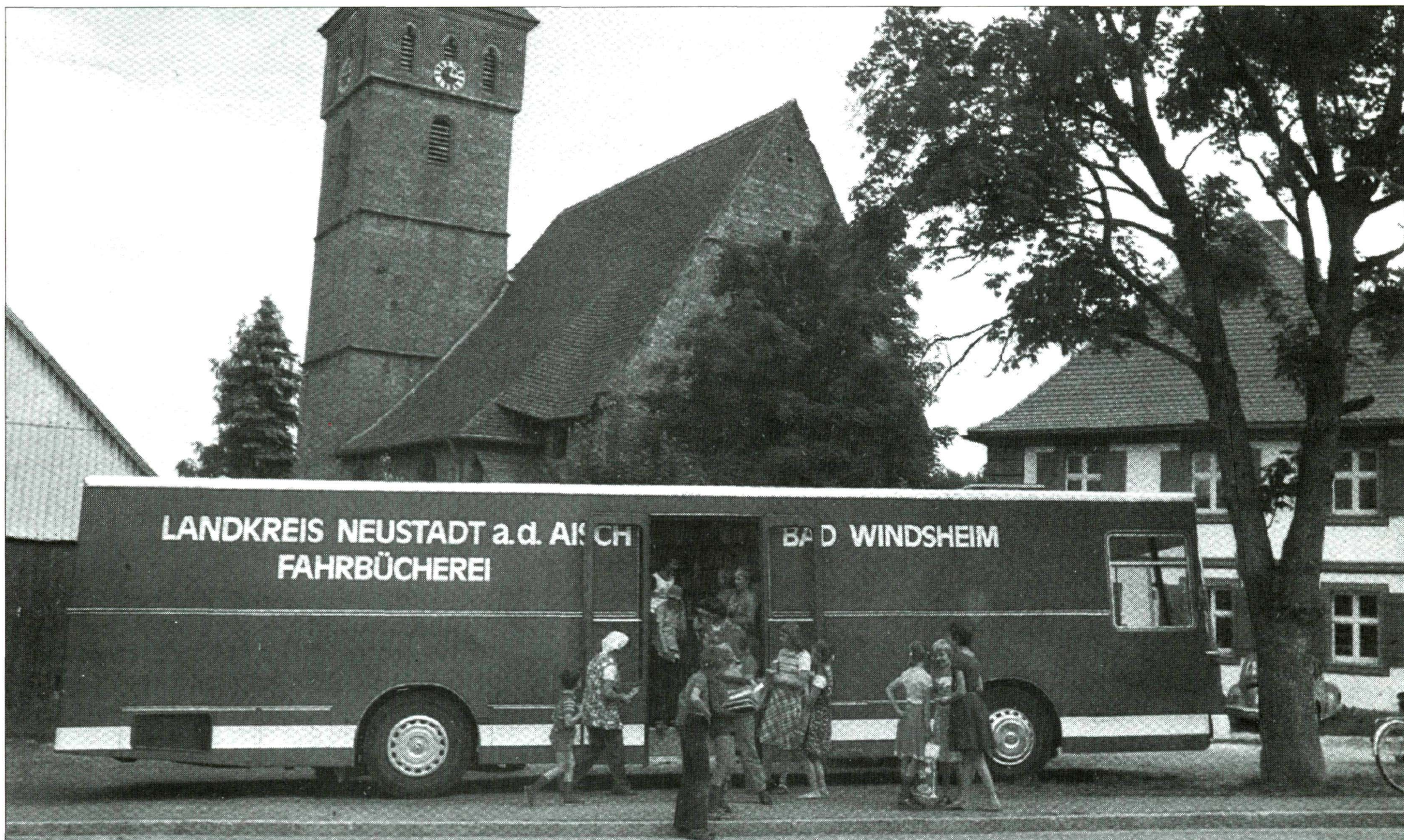
Το Βιβλιοαυτοκίνητο που βλέπουμε δεν είναι βέβαια της Ναυπάκτου...