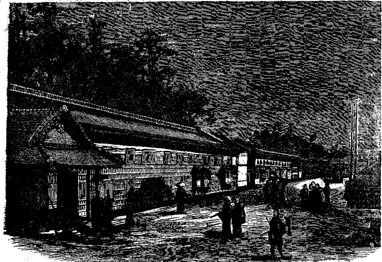
Ἐπαυλις ἐν Ἰαπωνίᾳ (1).

Ἄ Καὶ πάντες οἱ συγκεχυμένοι οὗτοι, ἤχοι, αἱ