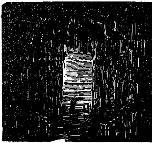
Τὸ σπήλαιον τοῦ Φιγκάλ.

Πόσον πλουσίως ἀντημεσίθησαν διὰ ταύτης τῆς παιδικῆς ἐξομολογήσεως ὅλοι οἱ κόποι τῆς καλῆς θεῖας καὶ πὼς ἠδύνατο αὐτὴ τῶρα νὰ ἀποβλέπῃ ἀφόβως εἰς τὸ μέλλον τῆς Ἀδελὰϊδος, ἀφοῦ τὸν κακὸν ἔχθρον τῆς ὠραίας αὐτῆς ἀγαπητῆς, δηλαδὴ τὴν ματαιοφροσύνην, ἠδύνατο νὰ νομίξῃ καταβεβλημένον; Κ ο Τ.