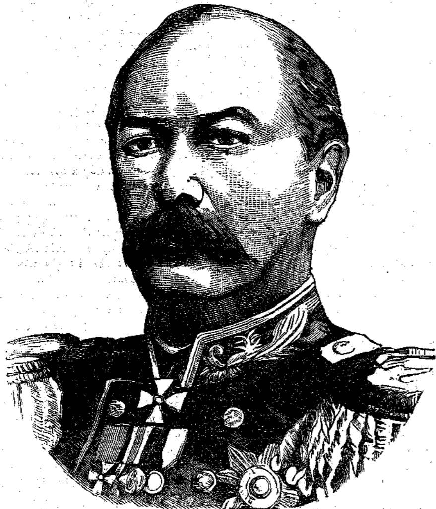
Ὁ πορθητὴς τῆς Πλέβνας ΤΟΤΛΕΒΕΝ

Ἐν τῶν σημειωτοτέρων και μᾶλλον ἐνδιαφερόντων προσώπων του ῥωσικοῦ στρατοῦ, ὁ στρατηγὸς Τοτλέβεν, ἐγεννήθη ἐν Μιτταῦ, τῆς Κουρλανδίας, Μάρτ 1818. Ἀνίκαν εἰς ἐμπορικὴν οἰκογένειαν προωρίζετο εἰς τὸ αὐτὸ στάδιον ὡς οἱ συγγενεῖς αὐτοῦ, ἐκπαιδευθεὶς πρὸς τοῦτο. Ἀλλ' ὁ νεανίας ἠσθάνετο ἐκυτὸν φερόμενον διὰ κλίσεως ἀκατασχέτου πρὸς τὴν τέχνην τῶν ὄπλων οἱ δὲ γονεῖς του δὲν ἀντέστησαν εἰς τὴν κλίσειν αὐτοῦ ταῦ-