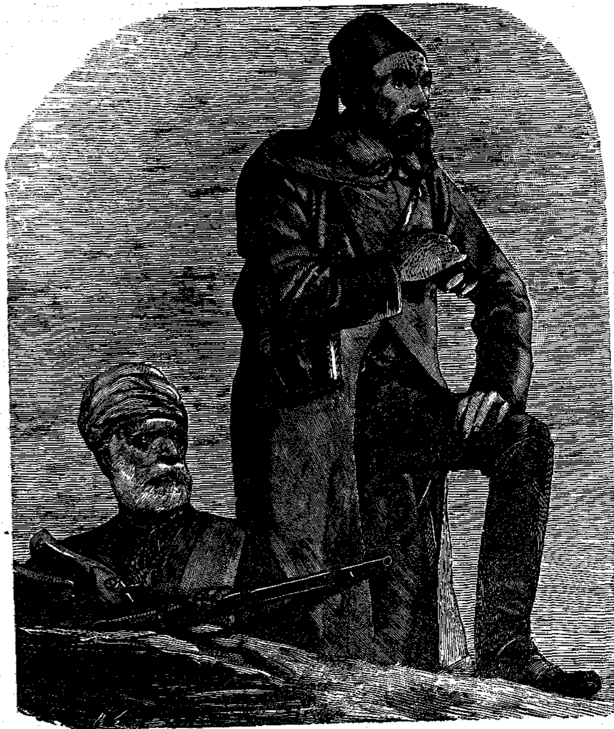
Ὁ ἥρωρ τῆς Πλέβνας ΟΣΜΑΝ ΠΑΣΣΑΣ

παρέστη εἰς τὴν ἀλωτὴν τῶν ὄχυρῶν τοῦ Μαλακῶφ. Πρὸς ἀνταμοιβὴν τῶν ἐξόχων αὐτοῦ ὑπηρεσιῶν, ὁ αὐτοκράτωρ τῆς Ῥωσσίας ἀπένευσε τὸν τίτλον τῆς κληρονομικῆς εὐγενείας εἰς τὸν στρατηγὸν Τοτλέβεν,