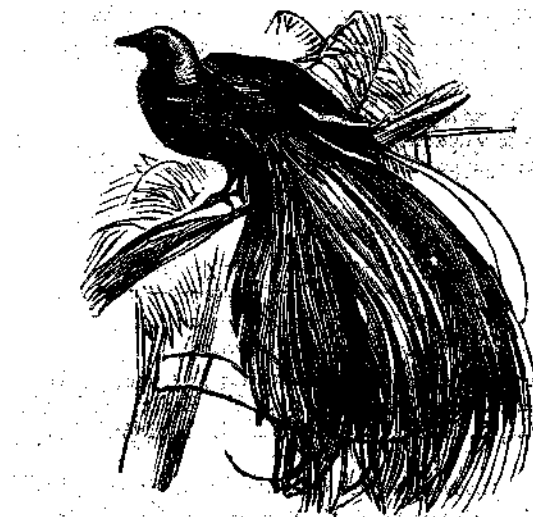
τοῦ ἔχει χρῶμα ὑπεμέλαν· ὁ λαιμὸς εἶναι χρυσοπράσινος· ἡ κεφαλὴ κιτρίνη· τὰ μακρὰ ἀπαλά πτερά τὰ

Πολλὰ ζῶα δυσάρεστον προξενούοντα εἰς ἡμᾶς ἐντύπωσιν ἔχουσιν πολλὴν τὴν καλλονὴν. Σκώληκες καὶ κάμβαι εἰσὶ δι' ἡμᾶς ἀηδέεις καὶ θμωὲς ἐν πολλοῖς αὐτῶν ὑπάρχουσιν ἄπειρα ὡραία χρώματα. Διὰ τὸ τοσαύτη ὡραϊότης ἐδόθη εἰς αὐτὰ; φαίνεται ὡσανεὶ ἦτο περιττὴ. Ἀλλὰ δὲν δύναται νὰ ἔχῃ οὕτω διότι ὁ Θεὸς ἔχει μίαν χρῆσιν δι' ὅτι δῆποτε ποιήσῃ γινώσκωμεν ὅτι δύναται νὰ ποιήσῃ τι ὡραῖον ὡς καὶ τι ἀπλοῦν. Ἴσως δὲ θέλει νὰ διδάξῃ ἡμῖν τὸ μάθημα τούτο ὅπταν ἐνδύῃ τοιαῦτα πλάσματα οἷα εἰσὶ οἱ σκώληκες καὶ αἱ κάμβαι με καλύμματα ὡραίων χρωμάτων. Ἀλλ' ἡμεῖς διαφόρως ποιούμεν προσπαθοῦμεν νὰ ποιήσωμεν ὡραία μόνον τὰ πράγματα ἐκείνα τὰ ὅποια ἐκτιμῶμεν πολὺ. Εἰσὶ τινὰ πράγματα τὰ ὅποια θά ἦτο μωρὰ κατανάλωσις χρόνου ἐκ μέρους ἡμῶν ἵνα τὰ κοσμήσωμεν· τούτο δὲ διότι ὀλίγον δυνάμεθα νὰ πράξωμεν ἵνα καταστήσωμεν τὰ πράγματα ὡραία· ἀλλὰ παρὰ τῷ Θεῷ οὐκ ἔστι τέλος τῆς δυνάμεως τοῦ δημιουργεῖν τὸ ὡραῖον· δύναται, διὰ τοῦ λόγου τῆς δυνάμεως αὐτοῦ νὰ ποιήσῃ θαυράσια πράγματα εὐαρεστοῦται.