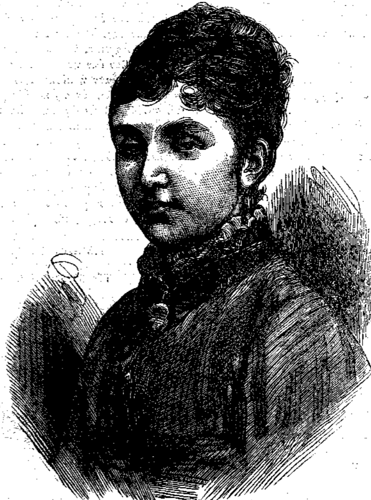
ΜΑΡΙΑ βασίλισσα της Ισπανίας.

φανή ή ήμέρα, και ανεζήτει εις το σκοτός διά του ψύχους και της χιόνος, την προς τα ψυχρά πλυσταιρία των πελατών αυτής άγούσαν όδόν, τρέμουσα δε εκ του ψύχους ήπλωνεν εν ύπαίθρῳ τα ύγρά ένδύματα, πεπηγότα ήδη εις τους δακτύλους της. Αμα δε ή έσπέρα έφθανεν επέστρεψε καθύργος και τρέμουσα, φέρουσα και την μικράν άντιμισθίαν την όποιαν μετά τοσούτου κόπου εκέρδησεν, εις την οικίαν της, την όποιαν συνήθως εύρισκε σκοτεινήν και ψυχράν, διότι ο εκ της ασθενείας καταβεβλημένος σύζυγός της δεν ήδύνατο ν' ανάψῃ ούχι μόνον πυρ άλλ' ουδέ φῶς. Πολύ λάκις επέστρεφεν εις τον οίκόν της σχεδόν τροχάδην, διότι ο φόβος μήπως βραδύνη έτάχυνε τα βήματά της. Επί εξ όλας εβδομάδας μόνον ανά πάσαν Κυριακήν έβλεπε τον σύζυγον και το τέκνον της την ήμέραν, τας δε λοιπὰς ήμέρας εις το άμυδρόν φῶς της λυχνίας.