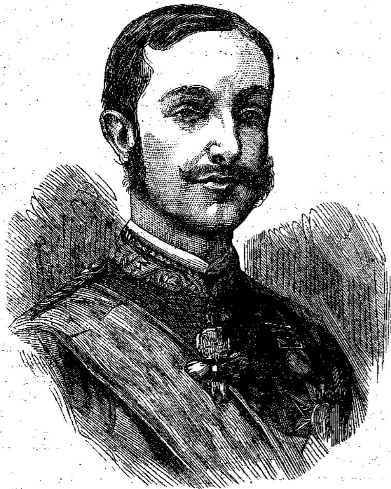
ΑΛΦΟΝΣΟΣ βασιλεύς της Ισπανίας

Η προσδοκία δεν έπετελέσθη άκριβώς, αλλά μία έγγονή του αποθανόντος βασιλέως των Γάλλων, ως βλέπομεν, ήλθε να συμμερισθή τον Ισπανικόν θρόνον μετά του υιού της βασίλισσας Ισαβέλλας, αλλά και αυτή δεν απέκλυσε επί πολυ της δόξης ταύτης. Η νεαρά βασίλισσα Μαρία, η Margaredes, ως οι Ισπανοί την απέκάλουν, απέθανεν εν ηλικία είκοσι έτων.