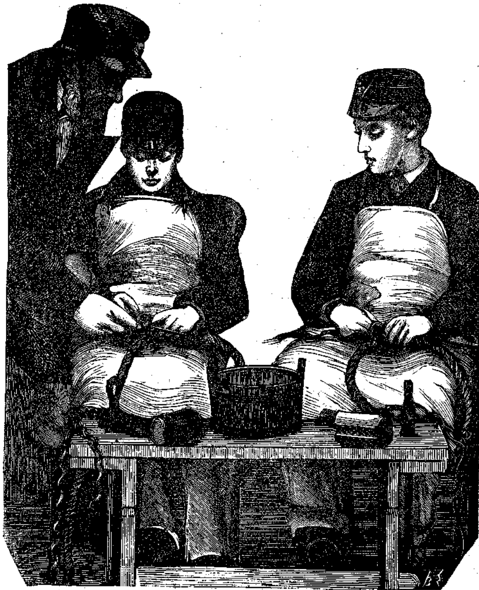
Αἱ Α. Β. Γ. οἱ Πρίγκηποι Ἀλβέρτος καὶ Βίκτωρ υἱοὶ τοῦ Πρίγκηπος τῆς Οὐαλλίας. Λαμβάνοντες τὸ πρῶτον μάθημα ἐπὶ τῆς σχινοπλοκίας.

δίας των νὰ συμμερισθῇ ἡ μία τὰς θλίψεις τῆς ἄλλης. Ὅτε δὲ ἐπανῆλθον εἰς τὴν πόλιν καὶ καθεὶς ἐπορεύθη εἰς τὸ δωμάτιόν του, ὁ μὲν Ἑρμᾶν εὗρεν ἀπροσδοκῆτως τὴν φίλην του ἀναμένουσαν αὐτὸν παρὰ τὸ κλειδοκύμβαλον, ὁ δὲ Βάλτερ ἐνῶ σύννοος καὶ μελαγχολικὸς εἶχε κλίνει τὴν κεφαλὴν ἐπὶ τῆς μικρᾶς τραπέζης του, ἔνθα ἐντός τοῦ πρὸ πολλοῦ κεκλεισμέ-