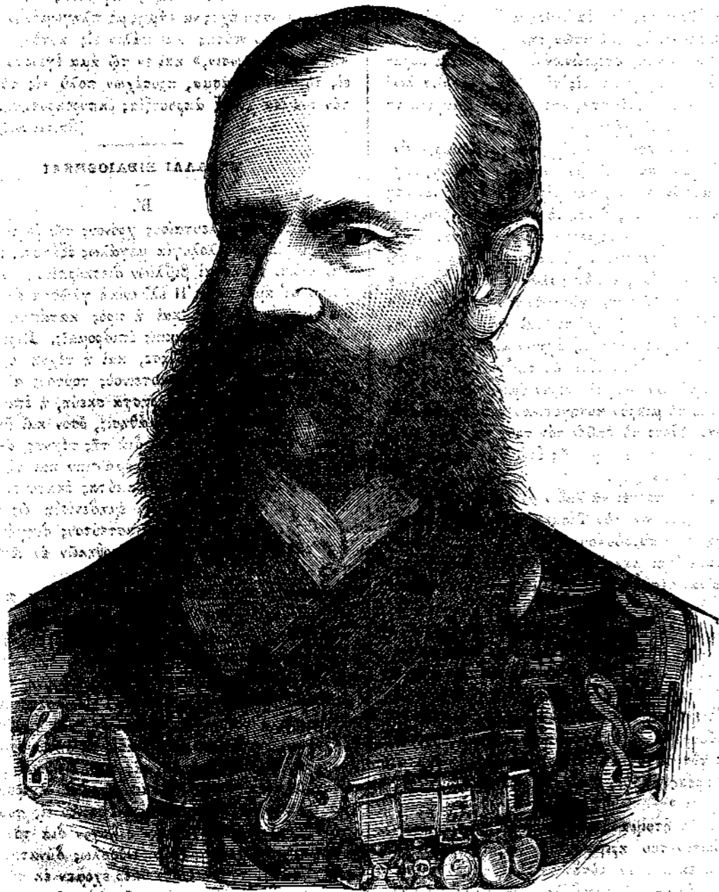
Ὁ Στρατηγὸς ΡΟΒΕΡΤΣ

λαϊῶν βιβλίων εὐρεται ἐνταῦθα» (ἐν Ἀγγλία). Ἡ πρὸς τὰ βιβλία διάθεσις ὅμως κατέστη γενικὴ καὶ εὐπαιδευτοὶ ἄνδρες συνήγαγον τὰς συλλογὰς αἰτίνες ἐφήμισαν τὴν Ρώμην, τὴν Φλωρεντίαν, τὴν Νεάπολιν, τὴν Ἑνετίαν, τὴν Βιένναν καὶ τοὺς Παρισίους. Πολὺ πρὸ τούτου—κατὰ τὴν ἀρχὴν τῆς 15 ἑκατονταστή-