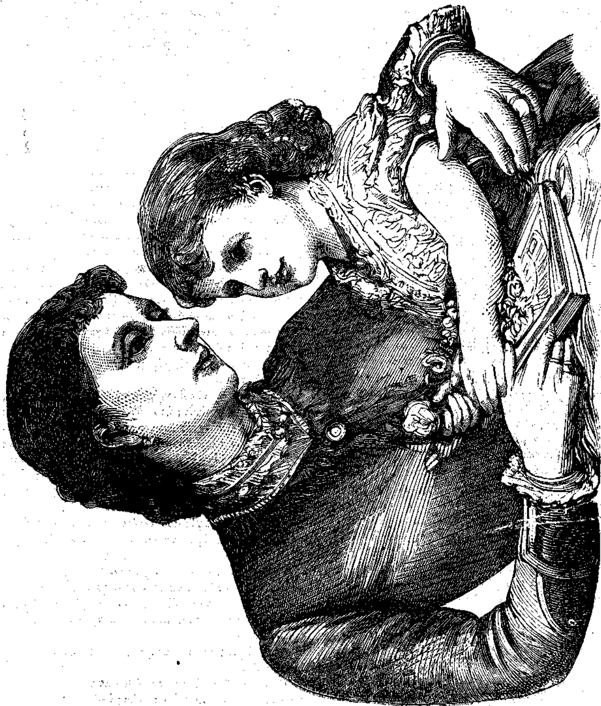
Ἡ Πριγκίπισσα ΑΛΙΚΗ.

τοῦ φονευμένου ζώου, θὰ εὕρη τὸν τρόπον νὰ τὸ ἐκβάλῃ ἔξω.» «Καλὰ! ἀφοῦ τὸ ἐγκρίνης», εἶπεν ὁ Βέρνερ, «πολλὰ καλὰ, θὰ ἴσκι ὑπεύθυνος, ἐάν ἔλοι οἱ κόποι καὶ οἱ ἀ-