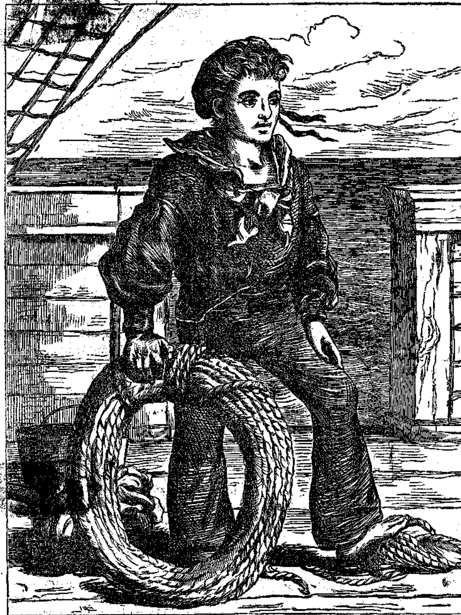
«Ἡ ἐλπίς ἡμῶν».

Ὁ Πόππου, κατεχόμενος ὑπὸ τοῦ ἐλέγχου τῆς συ- νειδήσεως, καὶ ἐντρομος ἐκ τῆς σιωπῆς τοῦ κυρίου του, ἐφέρετο ἕως τότε παθητικῶς, ἀλλ' ἰδὼν τὸ με- ταξὺ αὐτοῦ καὶ τοῦ πρώην κυρίου του βαθμηδὸν μυ- κηνόμενον διάστημα, κατελήφθη ὑπὸ δεινοῦ τινος προαισθήματος περὶ τῆς τύχης του, καὶ ἤρχισε νὰ ὀ- λολύξῃ καὶ νὰ κλαίῃ, ὡς ποτε προσκαλῶν τὸν κύριόν