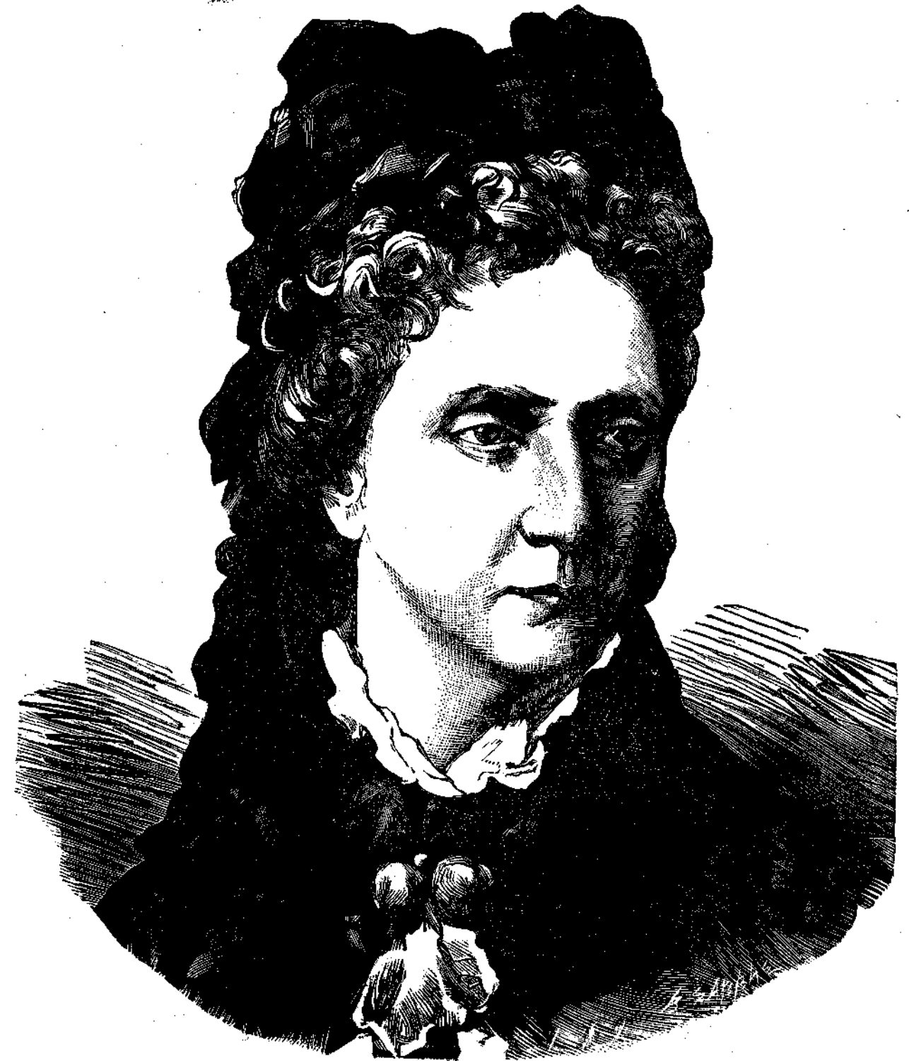
ΜΑΡΙΑ ΑΛΕΞΑΝΔΡΟΒΝΑ αὐτοκράτειρα τῆς Ῥωσίας

γράμμα τοῦ κυρίου Στεφάνου Ξένου (Παγκόσμιος Ἐκθεσις), ἀπαριστᾶ γυμνὸν ἄνδρα ἡμισεκῦμμένον καὶ κρατοῦντα ἀπὸ τὸν κρίκον κύνα δρμητικόν, θέλοντα ν' ἀφεθῆ κατόπιν τοῦ θηρέματός. Ἡ δὲ φυσιογνωμία τοῦ ἀγάλματος φαίνεται καὶ αὐτῇ ἐπίσης προσηλωμένη μακρὰν πρὸς τὴν θήραν. Ὁ Ἕλληνας κυνηγὸς εἰς τὴν ἀριστερὰν χεῖρα κρατεῖ τεμάχιον δόρατος.»