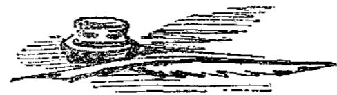
ΟΙ ΜΕΛΛΟΝΤΕΣ ΤΕΛΕΥΤΑΙΟΙ ΛΟΓΟΙ ΣΗΜΕΡΙΝΩΝ ΜΕΓΑΛΩΝ ΑΝΔΡΩΝ