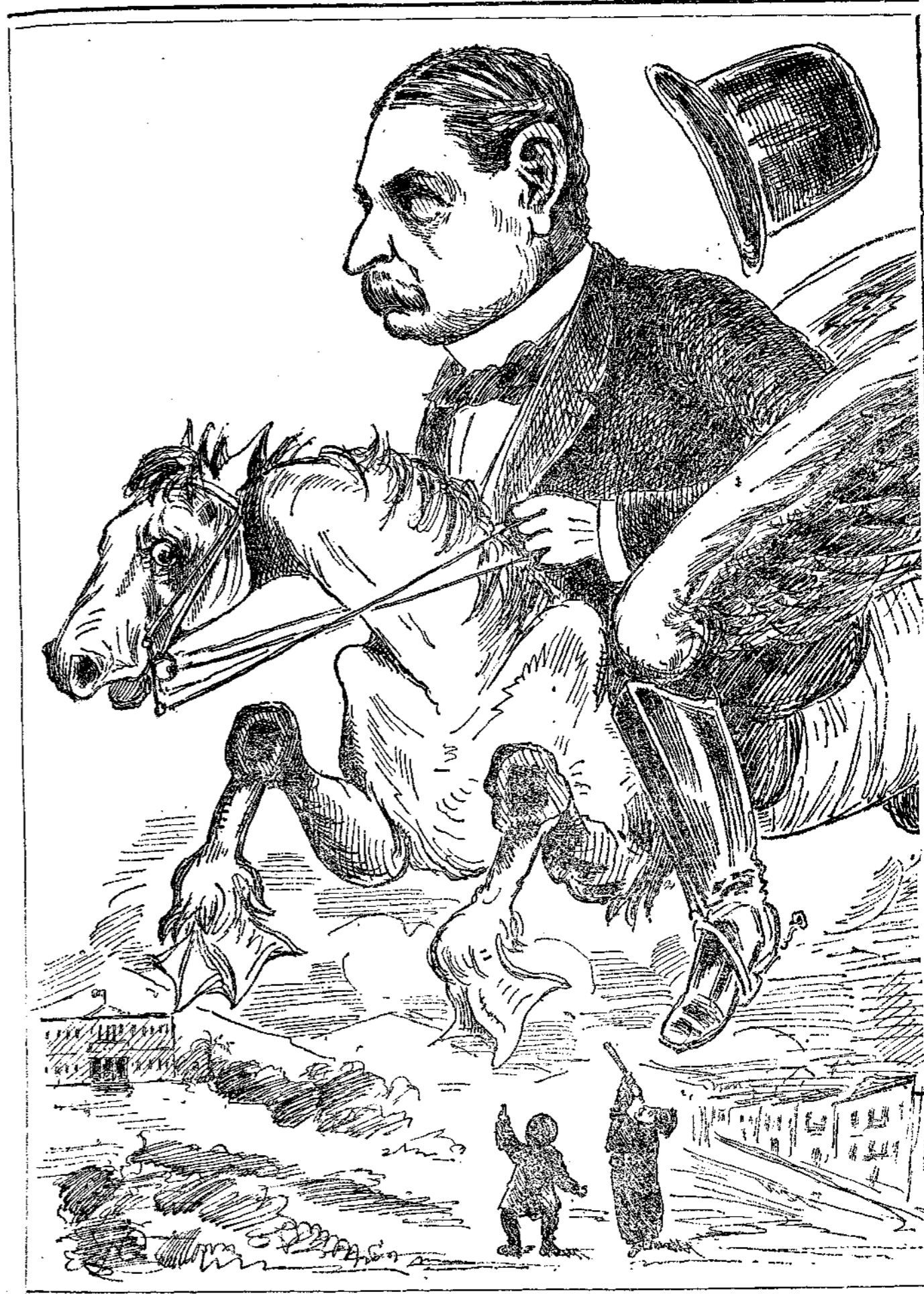
Ἄρσθρον ἀπὸ μηχανῆς.

Ἄρσθρον ὑπουργεῖον, καλούμενον σήμερον νὰ σῶσῃ ἡμᾶς διὰ σφαιγγῆς καὶ καταπλάσματος ἠθελεν εὐρεθῇ ἀκριβῶς εἰς ἡν θέσιν ὁ πατήρ τοῦ φιλογενεστάτου κ. Α. Τσιγκροῦ, παρὰ τὴν κλίνην ἀσθενοῦς, ἔστις μόνον διὰ πυρὸς ἢ στρε- χίνης ἠδύνατο νὰ σωθῇ.