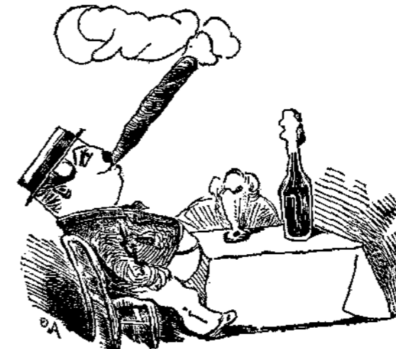
Ἵπερτροφία γενικὴ ἐξ ἀδιακόπου ἀσχολήσεως τοῦ ἐντερικοῦ σωλήνος. Αἰτιολογία. Καλὸ φαγί, καλὰ σιγᾶρα καὶ περίφημον κρασί. Θεραπεία. Δις τῆς ἡμέρας ἀνάβασις εἰς τὸν Λυκαβητόν. Δίαιτα. Ἐνας πενηντάρη ψωμί καθ' ἑκάστην, καὶ δύο ποτήρια νερὸ τῆς Καισαριανῆς.